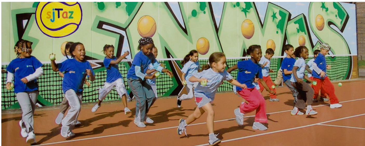
Enthousiast rennende kinderen op het Richard Krajicek Playground; op de achtergrond in graffiti de woorden TENNIS