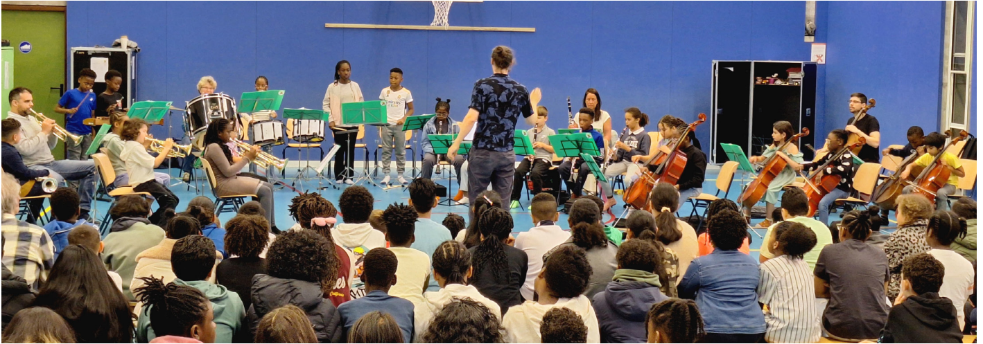
Tijdens het concert van groep 5 zit de zaal vol publiek. Groep 7 van De Tamboerijn is komen luisteren.