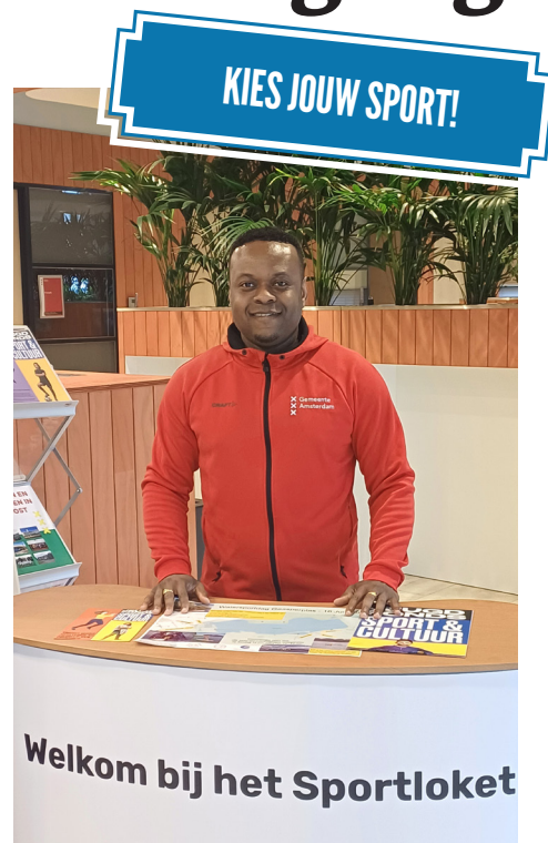
Vanuit het Sportloket zet Djogani zich in voor sport en bewegen in onze buurt.

Het Sportloket werkt samen met ROC, InHolland en de Hogeschool van Amsterdam. Het Sportloket helpt aankomende sportprofessionals in hun ontwikkeling door