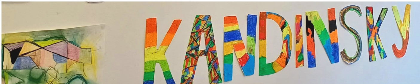
Tamboerijn exposeert met kunstwerken leerlingen over Kandinsky.