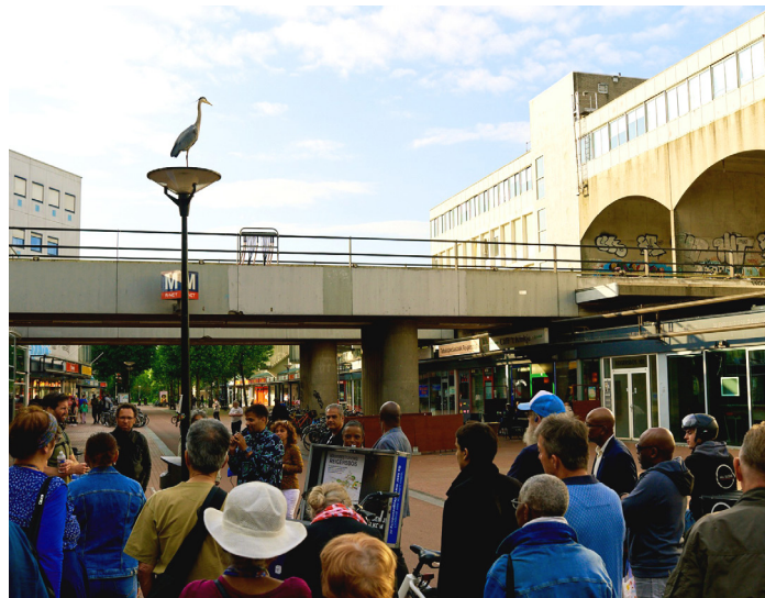
Bewoners krijgen uitleg over de nieuwbouwplekken in Centrumgebied Reigersbos