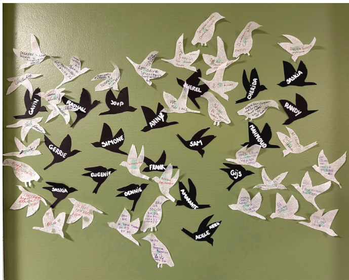
Platform Reigers: netwerk van actieve bewoners in Reigersbos