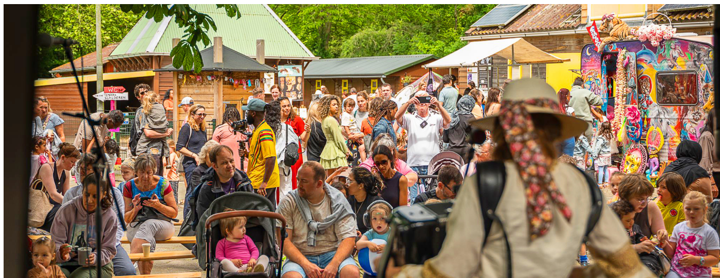
30 juni 2024: 't Brinkie viert haar 40ste verjaardag.

Op zondagmiddag 30 juni komen 600 mensen naar 't Brinkie. Wacht even, 't Brinkie is toch een kinderboerderij. ZESHONDERD mensen????