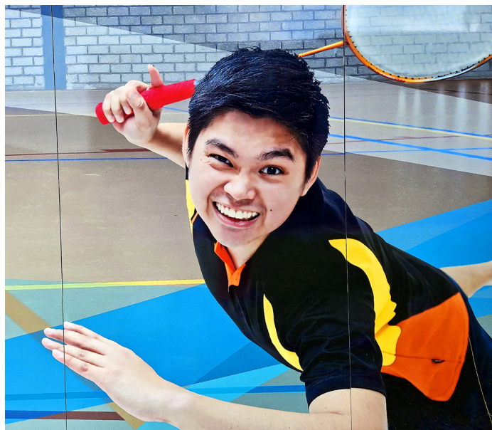
In de sporthal wordt competitie gespeeld voor badminton, tafeltennis, volleybal en zaal hockey.