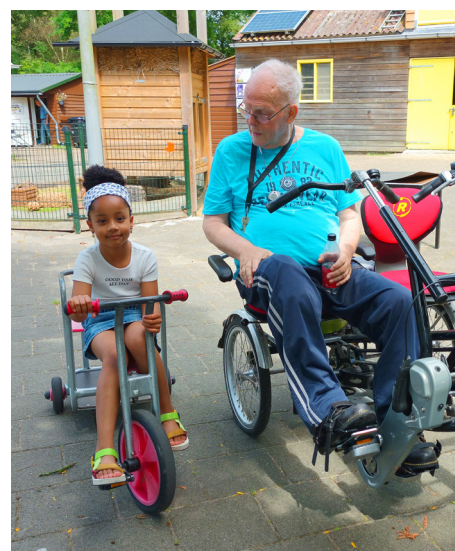
't Brinkie: voor jong & oud.