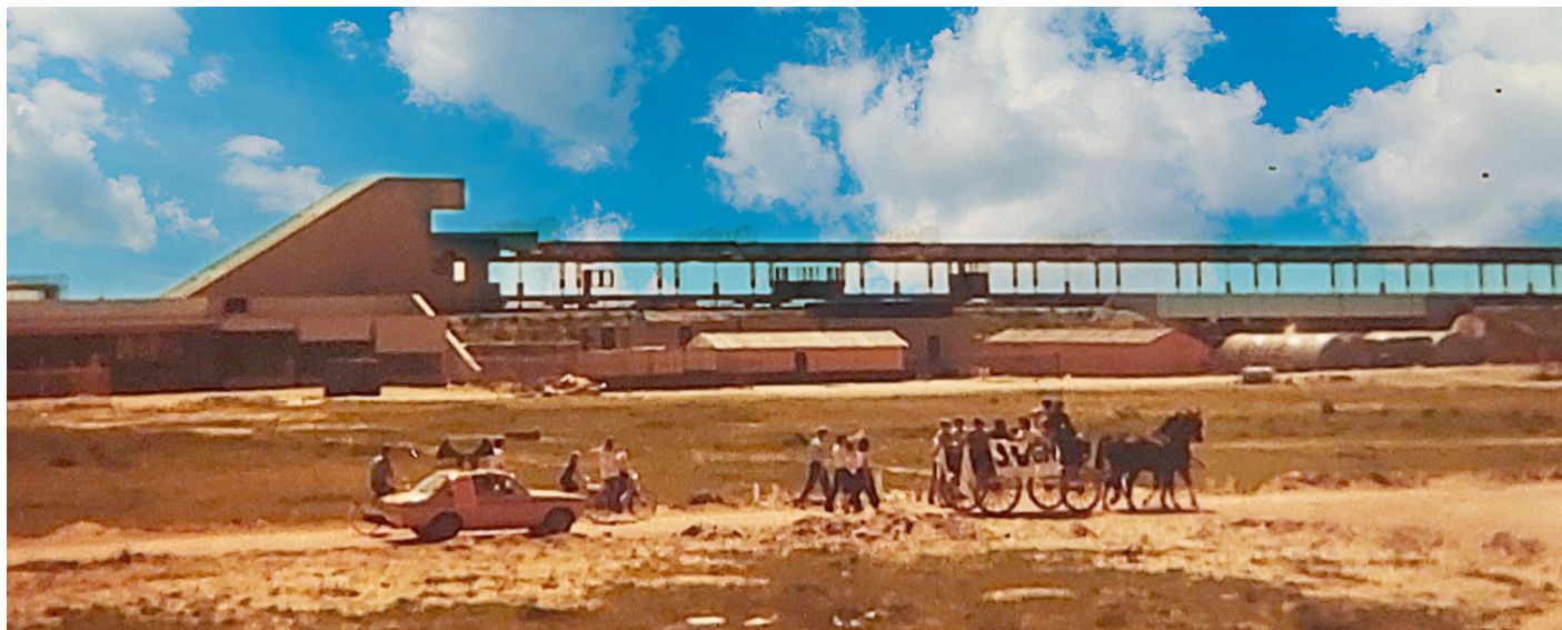
Metrostation Reigersbos in aanbouw

Door toeval kwam ik in Reigersbos terecht. Sinds 1977 woonde ik met mijn toenmalige partner in een tweekamerappartement in de torenflat Kralenbeek in de Bijlmer. De huur was hoog voor die tijd. Het was echter één van de weinige opties voor starters, want ja, ook toen hadden we te maken met een woningtekort. We wilden graag groter wonen en zagen onze kans toen in 1981 de bouw van Reigersbos startte. Helaas hadden we het inschrijfformulier gemist. Toen ik verwachtingsvol de woningbouwvereniging belde om alsnog te kunnen inschrijven werd me ietwat smalend verteld: "Mevrouw..., het zijn maar 77 huurwoningen!"