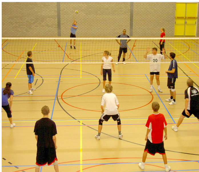
Volleybalvereniging Arena is vanaf de opening van de Sporthal Gaasperdam één van de trouwe gebruikers.

Al bijna 40 jaar een sportmiddelpunt van en door de buurt