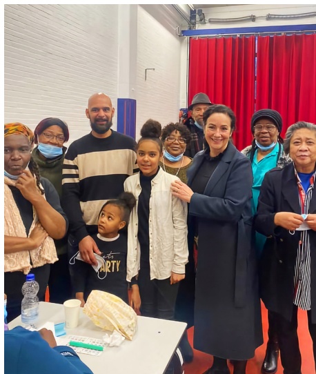
Bezoek van de burgemeester aan de Kazerne, januari 2022.

Dat is in mijn ogen echt de sterke gemeenschapszin. Er zijn tal